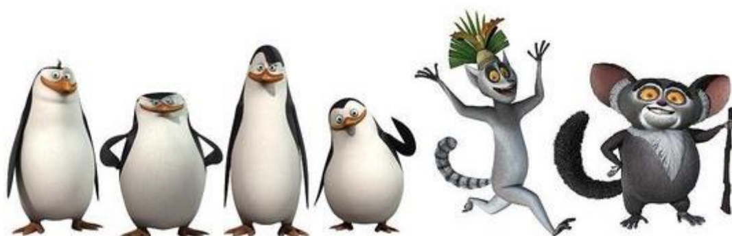
Rico Skipper Kowalski Szeregowy Król Julian Moris